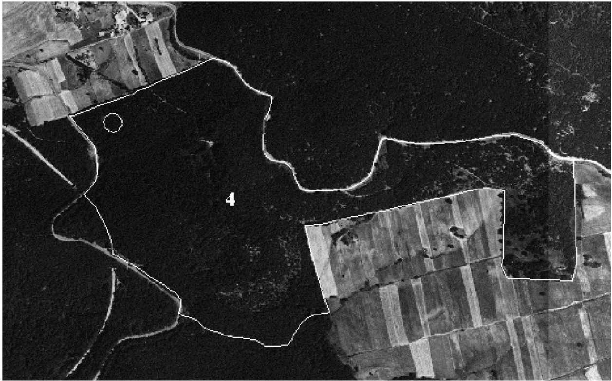
Foto aerea della particella 4 (in evidenza la localizzazione dell'area di saggio dimostrativa).