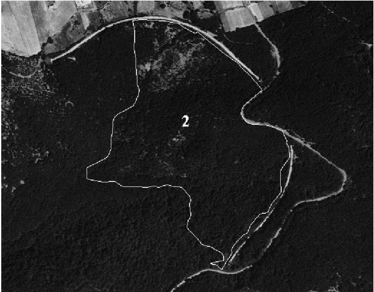
Foto aerea particella 2