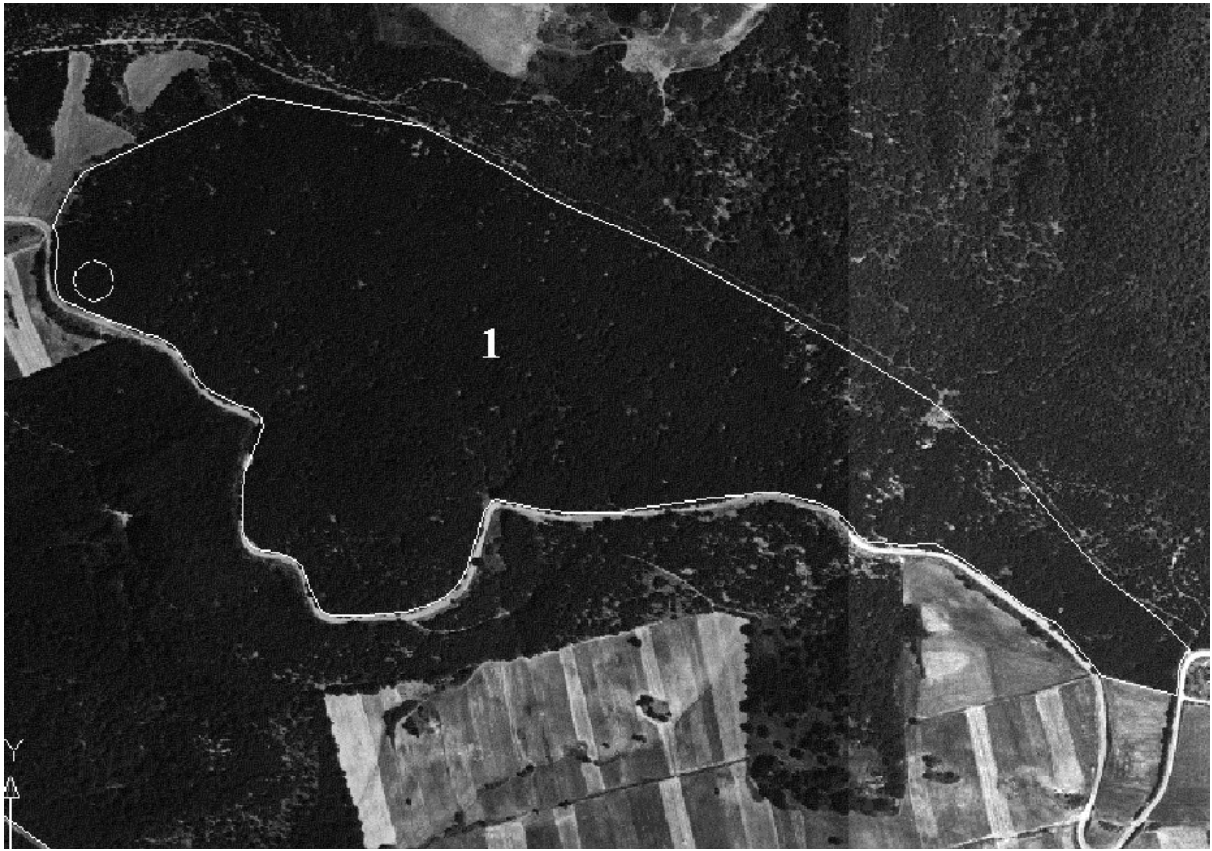
Foto aerea particella 1 (in evidenza l'area di saggio dimostrativa)